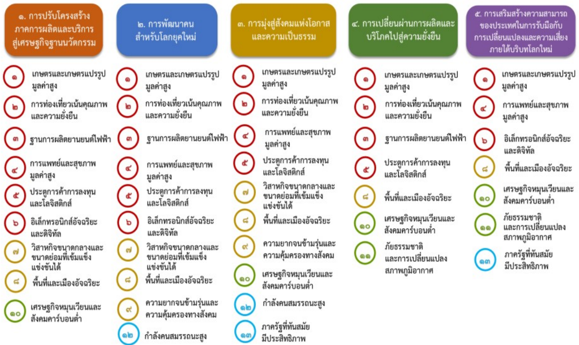
แผนภาพที่ ๓.๑ ความเชื่อมโยงระหว่างหมวดหมู่การพัฒนากับเป้าหมายหลัก

ความเชื่อมโยงระหว่างหมวดหมู่การพัฒนากับเป้าหมายหลักแสดงไว้ในแผนภาพที่ ๓.๑ โดยหมวดหมู่การพัฒนาที่กำหนดขึ้นเป็นประเด็นที่มีลักษณะเชิงบูรณาการที่ครอบคลุมการพัฒนาตั้งแต่ในระดับต้นน้ำจนถึงปลายน้ำ และสามารถนำไปสู่ผลพัฒนาทั้งในมิติเศรษฐกิจ สังคม ทรัพยากรธรรมชาติและสิ่งแวดล้อมไปพร้อมๆ กัน ทำให้หมวดหมู่แต่ละประการสามารถสนับสนุนเป้าหมายหลักได้มากกว่าหนึ่งข้อ นอกจากนี้การพัฒนาภายใต้แต่ละหมวดหมู่ไม่ได้แยกขาดจากกัน แต่มีการสนับสนุนหรือเอื้อประโยชน์ซึ่งกันและกัน